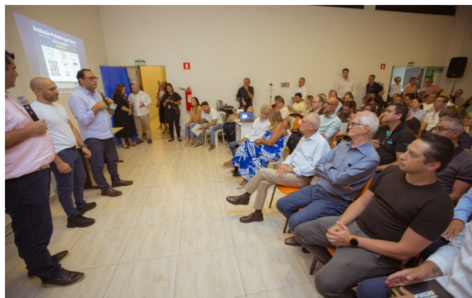
Loja do Futuro, lançado na FecomercioSP, chega a Marília

Confederações do Comércio e Indústria foram ao STF para contestar isenção do imposto nas compras internacionais até 50 dólares. Página 8